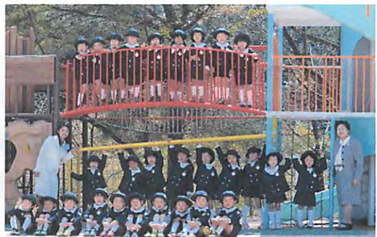
平成 28 年度年長児 かなぐみ