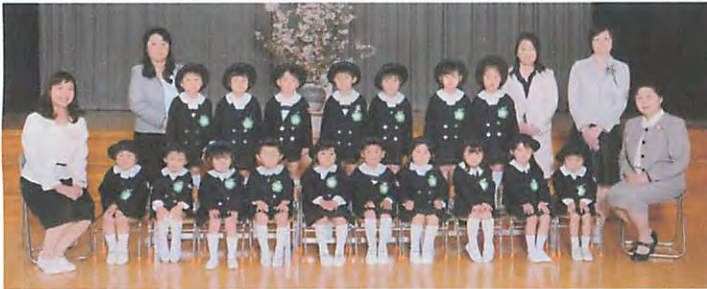
平成 28 年度年中児 きくぐみ