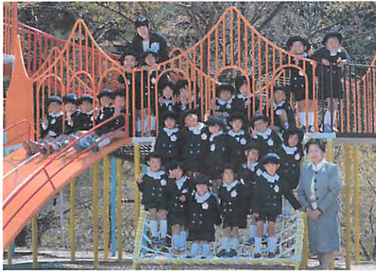
平成 28 年度年長児 さくらぐみ