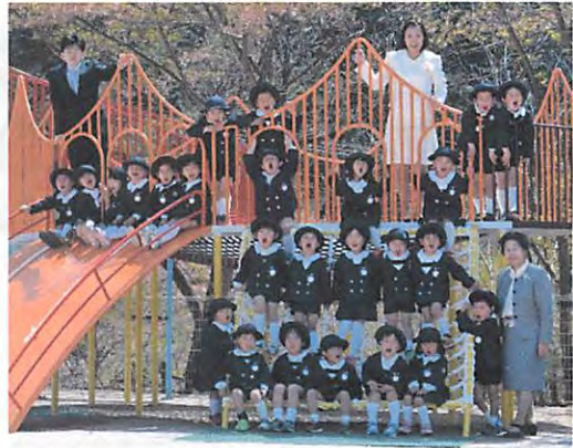
平成 28 年度年長児 すみれぐみ