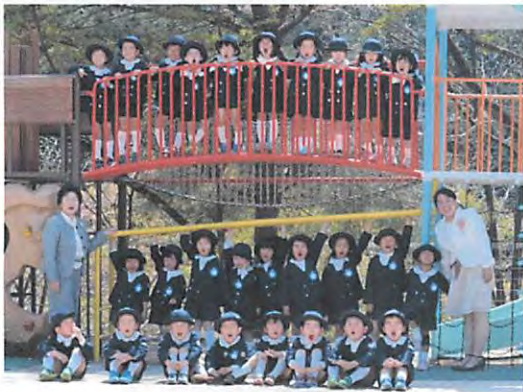
平成 28 年度年長児 あやめぐみ