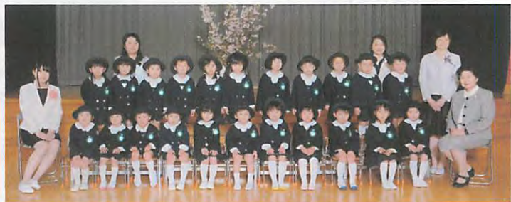
平成 28 年度年中児 れんげぐみ