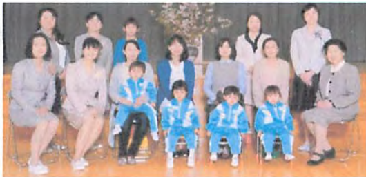
平成 28 年度未就園 どんぐりぐみ