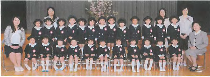
平成 28 年度年中児 ばらぐみ