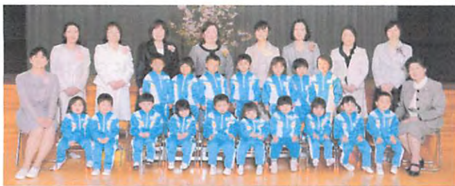
平成 28 年度未就園 つくしぐみ