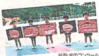
絵画・宙のコンクール