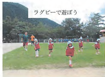
ラグビーで遊ぼう