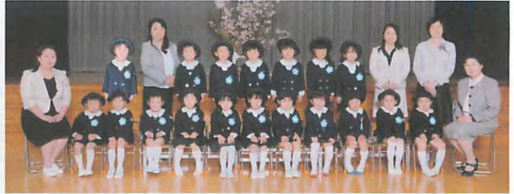
平成 28 年度年中児 ゆりぐみ