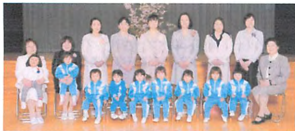
平成 28 年度未就園 さくらんぼぐみ