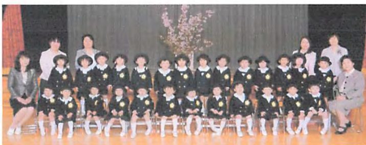
平成 28 年度年少児 たんぽぽぐみ