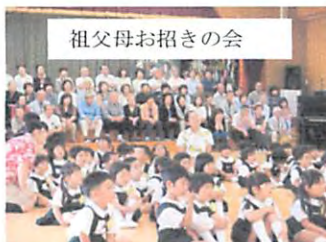
祖父母お招きの会