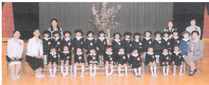
平成 28 年度年少児 ひまわりぐみ