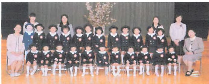
平成 28 年度年少児 ちゅうりっぷぐみ