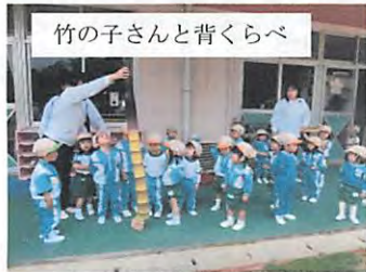
竹の子さんと背くらべ